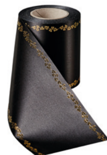
Art.-Nr.: 06738 Farbe: 031 schwarz