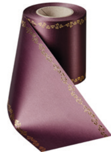
Art.-Nr.: 06738 Farbe: 037 pflaume