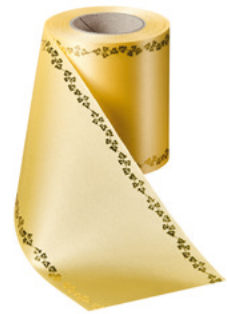
Art.-Nr.: 06738 Farbe: 017 mais