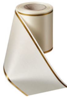
Art.-Nr.: 06508 Farbe: 003 natur