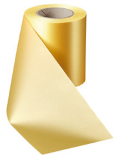
Art.-Nr.: 06000 Farbe: 017 mais