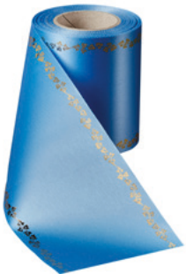
Art.-Nr.: 06738 Farbe: 054 kobaltblau