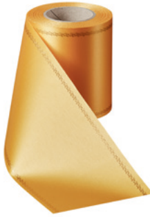
Art.-Nr.: 06078 Farbe: 053 freesia