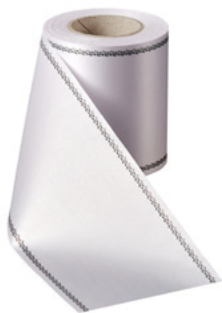
Art.-Nr.: 06079 Farbe: 001 weiß