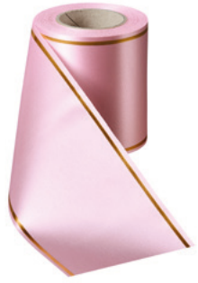
Art.-Nr.: 06508 Farbe: 094 rosa