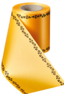
Art.-Nr.: 06739 Farbe: 053 freesia