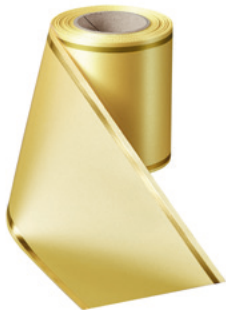
Art.-Nr.: 06508 Farbe: 017 mais