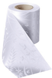
Art.-Nr.: 06990 Farbe: 001 weiß