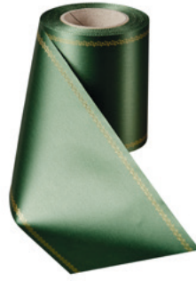
Art.-Nr.: 06078 Farbe: 020 grasgrün