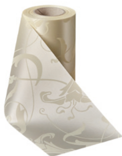
Art.-Nr.: 06860 Farbe: 003 natur