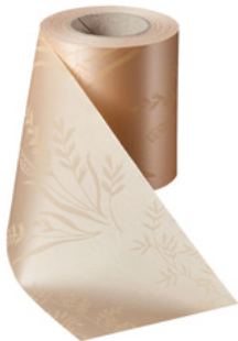
Art.-Nr.: 06890 Farbe: 075 beige