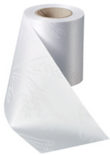
Art.-Nr.: 06890 Farbe: 001 weiß