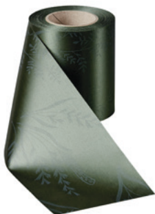
Art.-Nr.: 06890 Farbe: 029 moosgrün