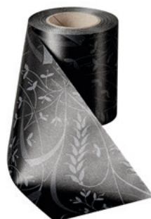
Art.-Nr.: 06990 Farbe: 031 schwarz