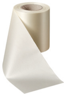
Art.-Nr.: 06000 Farbe: 003 natur