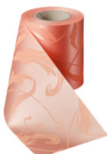
Art.-Nr.: 06860 Farbe: 081 apricot