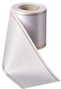
Art.-Nr.: 06078 Farbe: 001 weiß