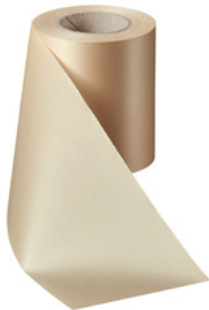
Art.-Nr.: 06000 Farbe: 075 beige