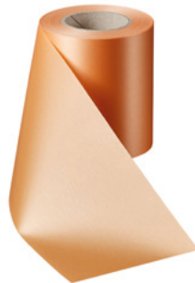
Art.-Nr.: 06000 Farbe: 073 pfirsich