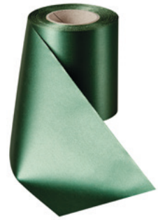
Art.-Nr.: 06000 Farbe: 027 flaschengrün