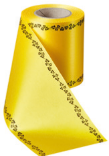
Art.-Nr.: 06739 Farbe: 057 gelb