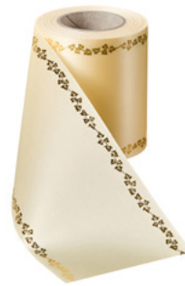
Art.-Nr.: 06738 Farbe: 015 sekt