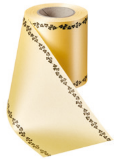
Art.-Nr.: 06739 Farbe: 017 mais