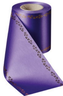
Art.-Nr.: 06738 Farbe: 085 lila