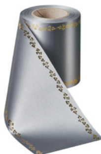
Art.-Nr.: 06738 Farbe: 023 anthrazit