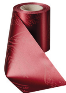
Art.-Nr.: 06890 Farbe: 019 kardinalrot