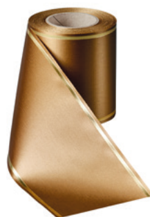
Art.-Nr.: 06508 Farbe: 064 braun