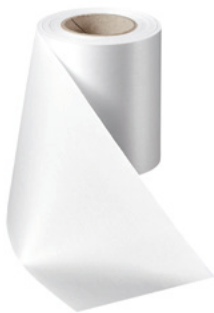
Art.-Nr.: 06000 Farbe: 001 weiß