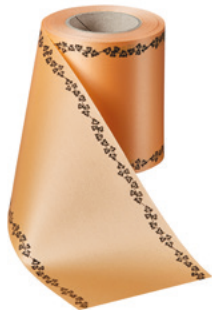
Art.-Nr.: 06739 Farbe: 073 pfirsich