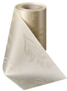
Art.-Nr.: 06890 Farbe: 003 natur