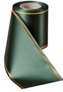
Art.-Nr.: 06508 Farbe: 027 flaschengrün