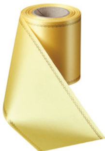
Art.-Nr.: 06078 Farbe: 017 mais