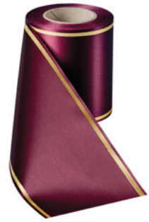
Art.-Nr.: 06508 Farbe: 019 kardinalrot