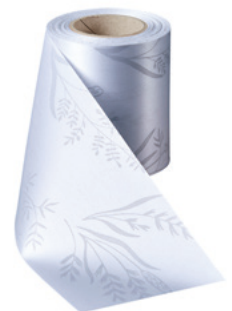
Art.-Nr.: 06890 Farbe: 022 hellgrau