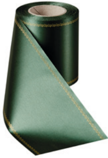
Art.-Nr.: 06078 Farbe: 027 flaschengrün