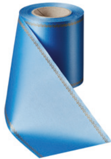
Art.-Nr.: 06078 Farbe: 054 kobaltblau