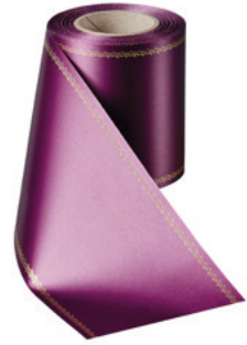
Art.-Nr.: 06078 Farbe: 061 erika brillant