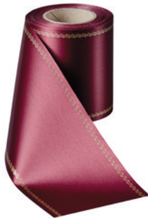
Art.-Nr.: 06078 Farbe: 019 kardinalrot