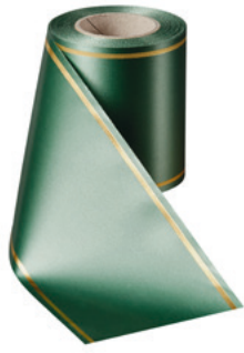
Art.-Nr.: 06508 Farbe: 020 grasgrün