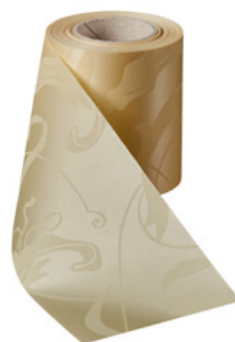
Art.-Nr.: 06860 Farbe: 015 sekt