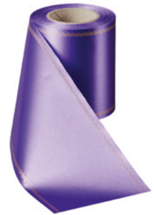
Art.-Nr.: 06078 Farbe: 085 lila