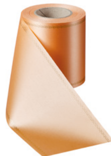
Art.-Nr.: 06078 Farbe: 073 pfirsich