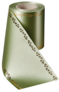
Art.-Nr.: 06738 Farbe: 079 hellgrün