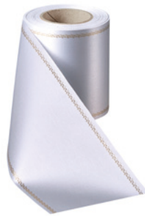
Art.-Nr.: 06078 Farbe: 022 hellgrau