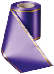
Art.-Nr.: 06508 Farbe: 085 lila