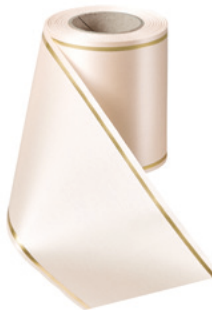
Art.-Nr.: 06508 Farbe: 075 beige