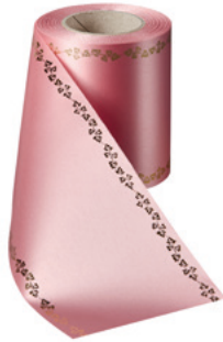
Art.-Nr.: 06738 Farbe: 097 wildrose