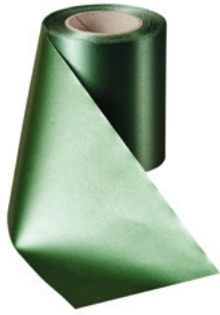
Art.-Nr.: 06000 Farbe: 020 grasgrün