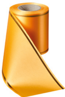
Art.-Nr.: 06508 Farbe: 053 fresia