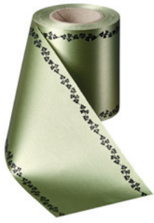
Art.-Nr.: 06739 Farbe: 079 hellgrün