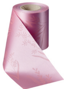
Art.-Nr.: 06890 Farbe: 097 wildrose