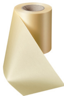
Art.-Nr.: 06000 Farbe: 015 sekt