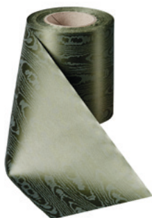
Art.-Nr.: 06970 Farbe: 029 moosgrün