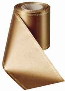
Art.-Nr.: 06078 Farbe: 064 braun