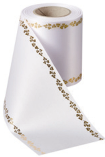
Art.-Nr.: 06738 Farbe: 001 weiß