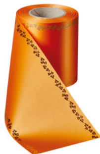
Art.-Nr.: 06738 Farbe: 086 terrakotta