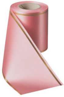
Art.-Nr.: 06508 Farbe: 097 wildrose