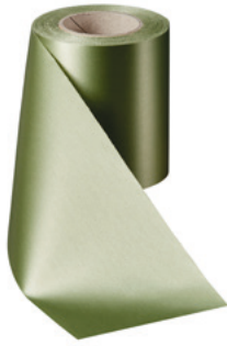
Art.-Nr.: 06000 Farbe: 079 hellgrün