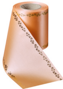
Art.-Nr.: 06738 Farbe: 073 pfirsich