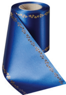
Art.-Nr.: 06738 Farbe: 025 enzianblau