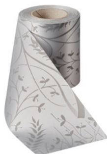
Art.-Nr.: 06990 Farbe: 022 hellgrau