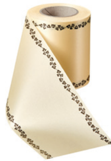
Art.-Nr.: 06739 Farbe: 015 sekt