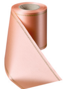
Art.-Nr.: 06078 Farbe: 081 apricot