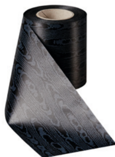
Art.-Nr.: 06970 Farbe: 031 schwarz