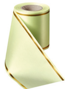
Art.-Nr.: 06508 Farbe: 070 limonengrün