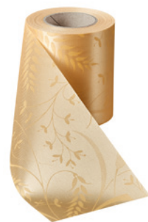
Art.-Nr.: 06990 Farbe: 075 beige