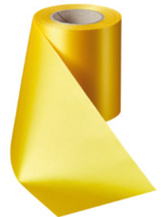
Art.-Nr.: 06000 Farbe: 057 gelb