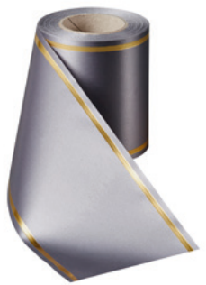
Art.-Nr.: 06508 Farbe: 023 antrazit