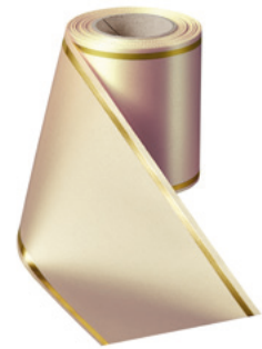
Art.-Nr.: 06508 Farbe: 015 sekt