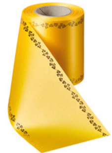
Art.-Nr.: 06738 Farbe: 057 gelb