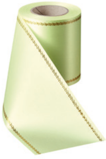
Art.-Nr.: 06078 Farbe: 070 limonengrün