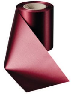
Art.-Nr.: 06000 Farbe: 019 kardinalrot