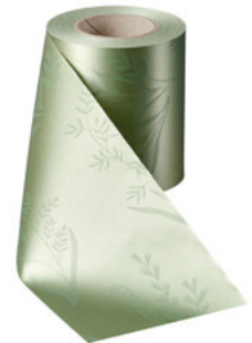
Art.-Nr.: 06890 Farbe: 079 hellgrün