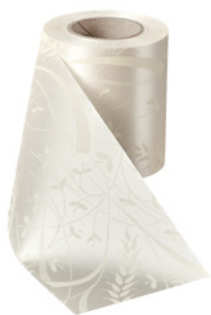
Art.-Nr.: 06990 Farbe: 003 natur