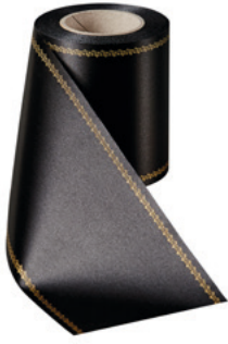
Art.-Nr.: 06078 Farbe: 031 schwarz