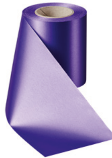
Art.-Nr.: 06000 Farbe: 085 lila