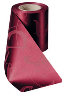
Art.-Nr.: 06860 Farbe: 019 kardinalrot