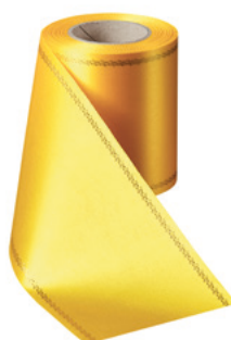
Art.-Nr.: 06078 Farbe: 057 gelb