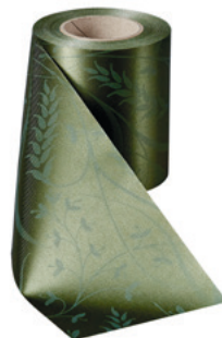
Art.-Nr.: 06990 Farbe: 029 moosgrün