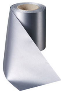
Art.-Nr.: 06000 Farbe: 023 anthrazit