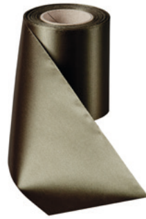
Art.-Nr.: 06000 Farbe: 029 moosgrün