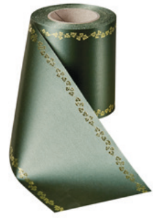
Art.-Nr.: 06738 Farbe: 027 flaschengrün