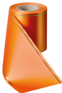
Art.-Nr.: 06508 Farbe: 086 terracotta