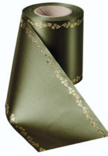
Art.-Nr.: 06738 Farbe: 029 moosgrün