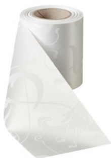
Art.-Nr.: 06860 Farbe: 001 weiß