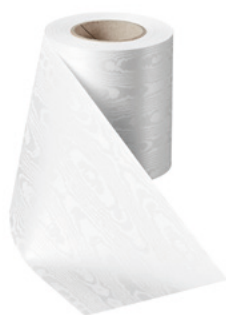
Art.-Nr.: 06970 Farbe: 001 weiß