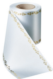
Art.-Nr.: 06738 Farbe: 022 hellgrau