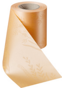
Art.-Nr.: 06890 Farbe: 073 pfirsich