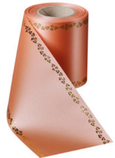
Art.-Nr.: 06739 Farbe: 081 apicot