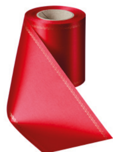
Art.-Nr.: 06078 Farbe: 026 rot