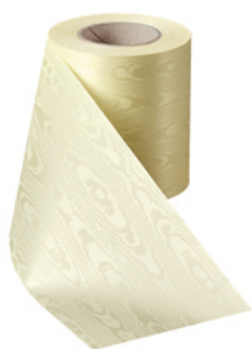
Art.-Nr.: 06970 Farbe: 015 sekt