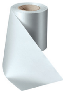
Art.-Nr.: 06000 Farbe: 022 hellgrau