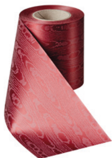
Art.-Nr.: 06970 Farbe: 019 kardinalrot