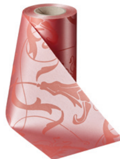
Art.-Nr.: 06860 Farbe: 097 wildrose