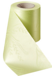
Art.-Nr.: 06890 Farbe: 070 limonengrün