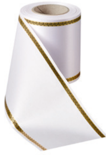
Art.-Nr.: 06064 Farbe: 001 weiß