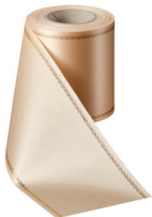
Art.-Nr.: 06078 Farbe: 075 beige