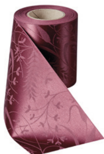
Art.-Nr.: 06990 Farbe: 019 kardinalrot