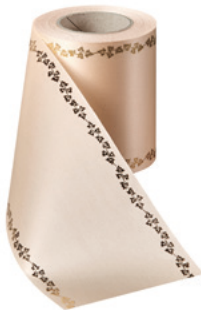
Art.-Nr.: 06738 Farbe: 075 beige