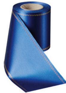
Art.-Nr.: 06078 Farbe: 025 enzianblau