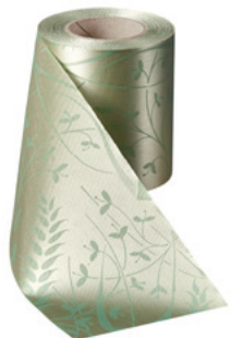
Art.-Nr.: 06990 Farbe: 079 hellgrün