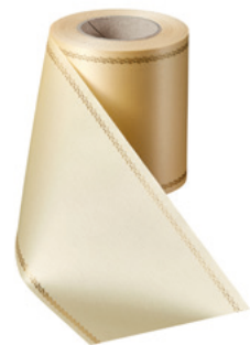
Art.-Nr.: 06078 Farbe: 015 sekt