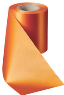
Art.-Nr.: 06000 Farbe: 086 terrakotta