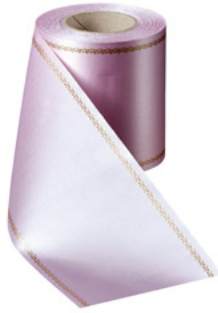
Art.-Nr.: 06078 Farbe: 094 rosa