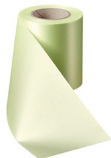
Art.-Nr.: 06000 Farbe: 070 limonengrün