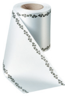
Art.-Nr.: 06739 Farbe: 022 hellgrau

Kranzband aus Super-Satin besteht mit einer besonders weichen, gleichmäßigen und glatten Oberfläche, die seidig glänzt. Es eignet sich hervorragend für den Thermotransferdruck. Das Band ist außerdem wasserfest und umweltfreundlich, da es ein leicht verrottbares Zellulose Holzprodukt ist.