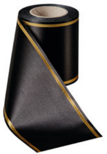
Art.-Nr.: 06508 Farbe: 031 schwarz