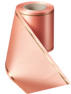
Art.-Nr.: 06508 Farbe: 081 apricot