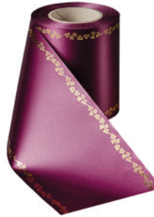
Art.-Nr.: 06738 Farbe: 061 erika brillant