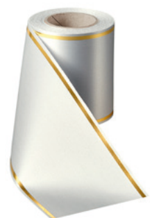
Art.-Nr.: 06508 Farbe: 022 hellgrau