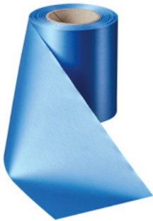
Art.-Nr.: 06000 Farbe: 054 kobaltblau