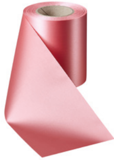
Art.-Nr.: 06000 Farbe: 097 wildrose