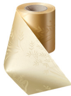
Art.-Nr.: 06890 Farbe: 015 sekt