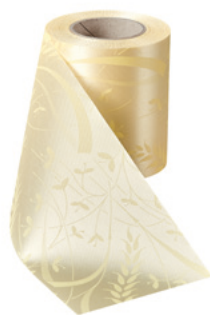
Art.-Nr.: 06990 Farbe: 015 sekt