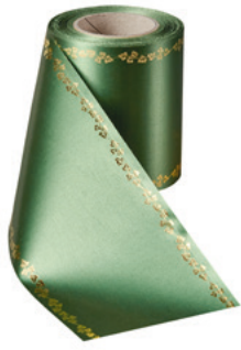
Art.-Nr.: 06738 Farbe: 020 grasgrün