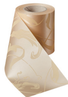
Art.-Nr.: 06860 Farbe: 075 beige