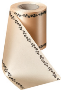
Art.-Nr.: 06739 Farbe: 075 beige