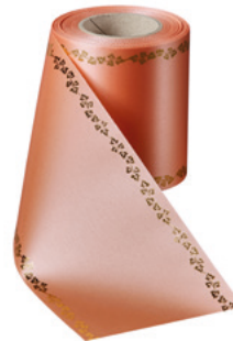
Art.-Nr.: 06738 Farbe: 081 apricot