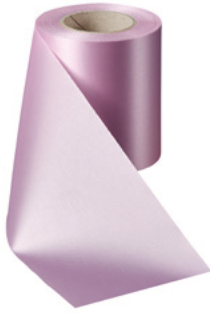
Art.-Nr.: 06000 Farbe: 094 rosa