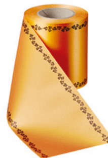
Art.-Nr.: 06739 Farbe: 086 terrakotta