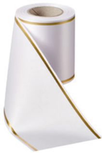
Art.-Nr.: 06508 Farbe: 001 weiß