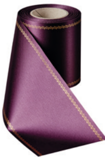
Art.-Nr.: 06078 Farbe: 037 pflaume