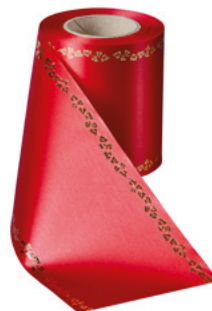
Art.-Nr.: 06738 Farbe: 026 rot