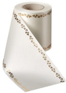
Art.-Nr.: 06738 Farbe: 003 natur