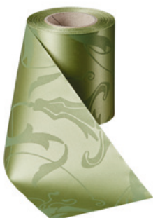
Art.-Nr.: 06860 Farbe: 079 hellgrün