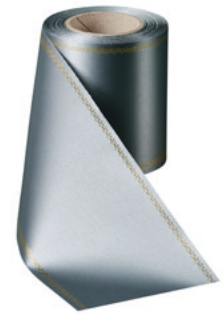
Art.-Nr.: 06078 Farbe: 023 anthrazit