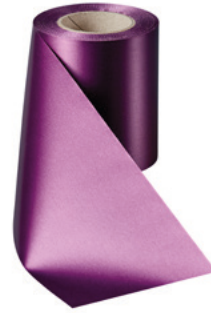
Art.-Nr.: 06000 Farbe: 061 erika brillant