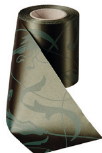
Art.-Nr.: 06860 Farbe: 029 moosgrün