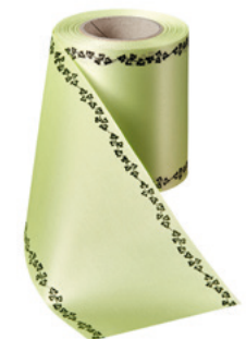
Art.-Nr.: 06739 Farbe: 070 limonengrün