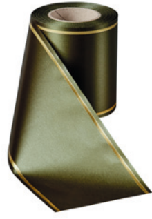
Art.-Nr.: 06508 Farbe: 029 moosgrün