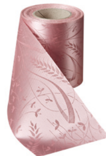
Art.-Nr.: 06990 Farbe: 097 wildrose