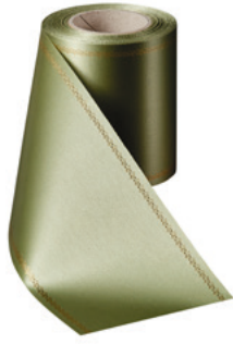
Art.-Nr.: 06078 Farbe: 079 hellgrün