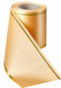
Art.-Nr.: 06508 Farbe: 073 pfirsich