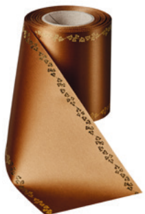
Art.-Nr.: 06738 Farbe: 064 braun