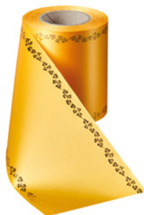
Art.-Nr.: 06738 Farbe: 053 freesia