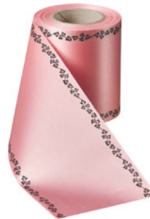
Art.-Nr.: 06739 Farbe: 097 wildrose