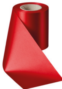
Art.-Nr.: 06000 Farbe: 026 rot