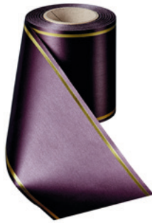
Art.-Nr.: 06508 Farbe: 037 pflaume