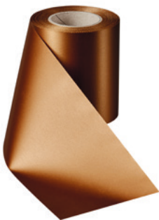
Art.-Nr.: 06000 Farbe: 064 braun