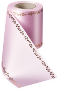
Art.-Nr.: 06738 Farbe: 094 rosa