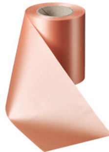
Art.-Nr.: 06000 Farbe: 081 apricot