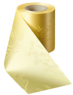
Art.-Nr.: 06890 Farbe: 017 mais