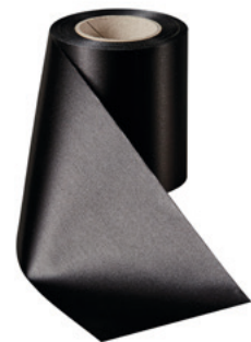
Art.-Nr.: 06000 Farbe: 031 schwarz