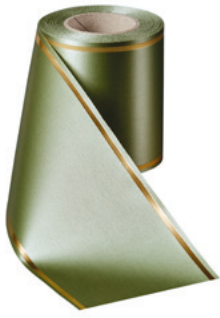
Art.-Nr.: 06508 Farbe: 079 hellgrün