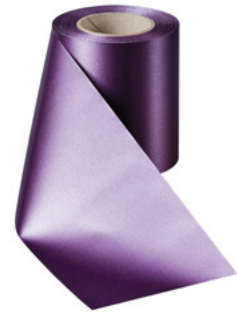
Art.-Nr.: 06000 Farbe: 037 pflaume