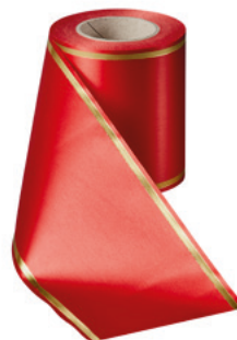
Art.-Nr.: 06508 Farbe: 026 rot