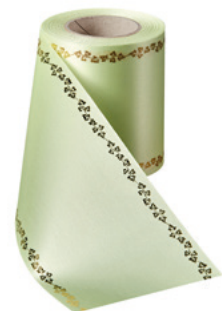
Art.-Nr.: 06738 Farbe: 070 limonengrün