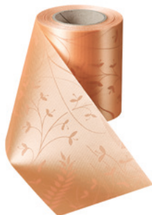
Art.-Nr.: 06990 Farbe: 073 pfirsich