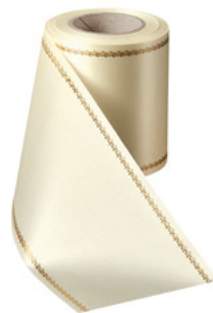
Art.-Nr.: 06078 Farbe: 003 natur