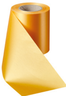
Art.-Nr.: 06000 Farbe: 053 freesia