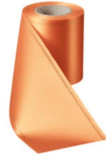
Art.-Nr.: 06078 Farbe: 086 terrakotta