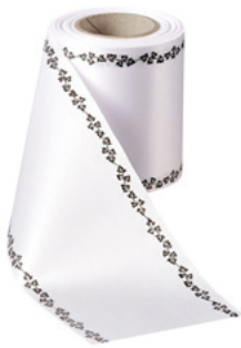
Art.-Nr.: 06739 Farbe: 001 weiß