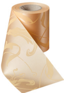
Art.-Nr.: 06860 Farbe: 073 pfirsich