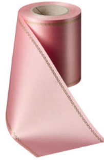
Art.-Nr.: 06078 Farbe: 097 wildrose