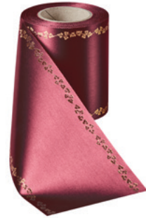
Art.-Nr.: 06738 Farbe: 019 kardinalrot