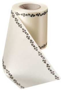
Art.-Nr.: 06739 Farbe: 003 natur