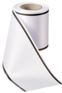
Art.-Nr.: 06509 Farbe: 001 weiß