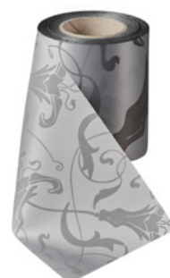
Art.-Nr.: 06860 Farbe: 022 hellgrau