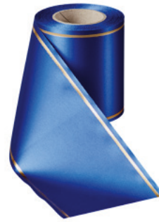
Art.-Nr.: 06508 Farbe: 025 enzianblau