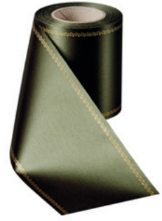
Art.-Nr.: 06078 Farbe: 029 moosgrün