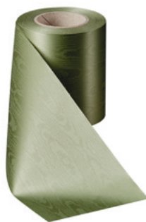
Art.-Nr.: 06970 Farbe: 079 hellgrün